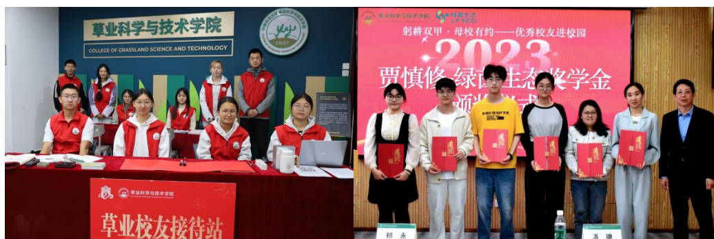
左图：在校学子参与校友返校接待志愿工作

作为在校学子，同样也成为学科文化的追随者和受益者。在校庆活动中，他们主动承担志愿服务工作，在接待站引导校友返校，在实践摄影展中讲解学科故事。在校友祁永以恩师之名设立的“贾慎修——绿茵生态”奖学金评选中，他们薪火相传，展现了新一代草业人的优秀品质，以榜样力量传递学科精神；在校友企业开展的实习实践钟，他们锐意进取，深化产学合作，将“草原生态保护”、“草畜平衡”等学科理念转化为产业实践，获得多项国家级双创奖励荣誉，推动学科文化在服务国家战略中彰显价值。