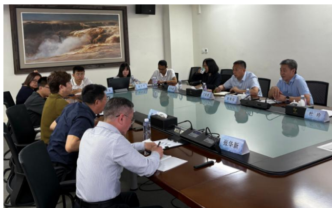
图：走访校友企业天津绿茵景观生态建设股份有限公司，同企业开展沟通交流

学院坚持将“走出去”和“请进来”相结合，积极走访或邀请校友企业或校友入职企业，就人才培养路径、校企合作模式、育人平台建设、就业岗位拓展等方面进行沟通交流，不断深化合作基础，夯实学院发展建设，共谋草业发展新篇。今年，学院走访校友企业天津绿茵景观生态建设股份有限公司，并与企业负责人开展沟通交流，积极帮助毕业生拓展就业岗位，成功解决多名学生就业问题。