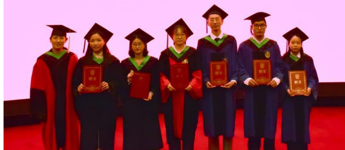
图：校友联络员聘任仪式