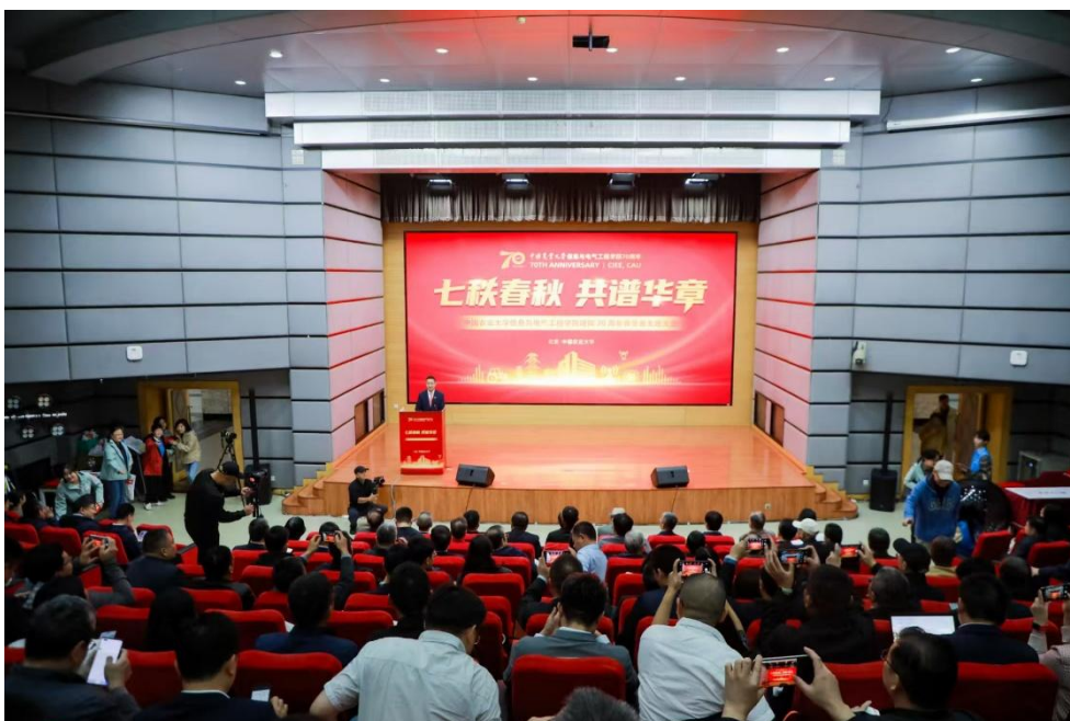
图 3 建院 70 周年高质量发展大会