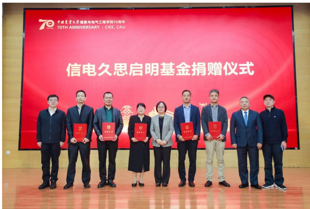
图4 “久思启明”基金捐赠仪式

造智慧农业展示厅、校友墙、学生活动、荣休教师风采等文化空间，一批用于改善教学科研条件的工程顺利完工，学院的硬件保障水平和人文环境显著提升。