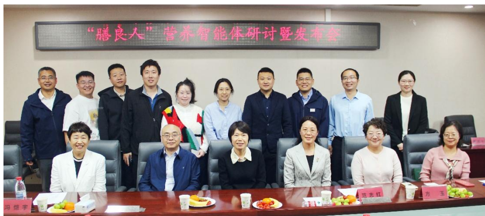
图 2 膳良人 AI 营养智能体发布会

通过云直播、智慧展品展示、知识库等新技术，打破了时空限制，体现科技与人文交融的魅力。