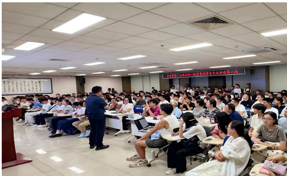
图1 “百廿学术·七秩信研”校友系列学术交流活动

开辟“百廿学术 七秩信研”新闻专栏，专题宣传学院在科学研究、人才培养等方面取得的新成就。